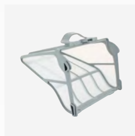
Bac filtrant Filtre très fin rigide de grande capacité (5 litres)